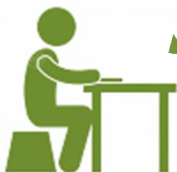
Les officiels de table