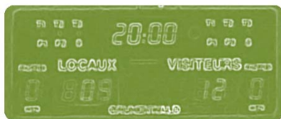
Tableau affichage score et temps